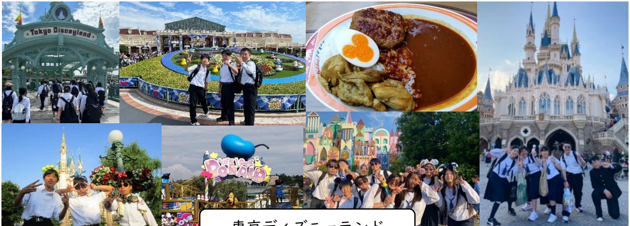
東京ディズニーランド

その後、楽しみにしていたディズニーランドに向かい、グループ別行動を行いました。アトラクションに乗ったり、お土産を買ったりと、たくさんの思い出を作ることができました。