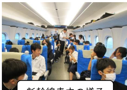
新幹線車内の様子