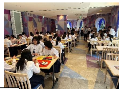
東京ディズニーセレブレーションホテル