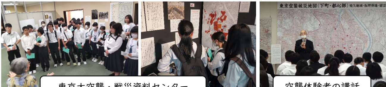
東京大空襲・戦災資料センター

修学旅行最終日には、「東京大空襲・戦災資料センター」を訪問しました。講師の方から体験談をうかがい、実際に戦火を浴びた生活用品などの資料を見学させていただきました。平和な未来のために自分たち一人ひとりに何ができるのかを考える機会となりました。