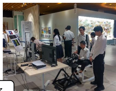
日本オリンピックミュージアムでの様子

その後、相撲で有名な両国に移動し、夕食にちゃんこ鍋を食べました。1日目のラストは「スカイツリー」。あいにくの雨で、外の景色はあまり見ることはできませんでしたが、ガラス床を体験したり、お土産を見たりと楽しい時間を過ごすことができました。