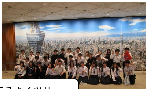
東京スカイツリー

修学旅行2日目は、ホテルで朝食後、バス・電車で移動し、フジTV・お台場周辺で班別行動を行いました。