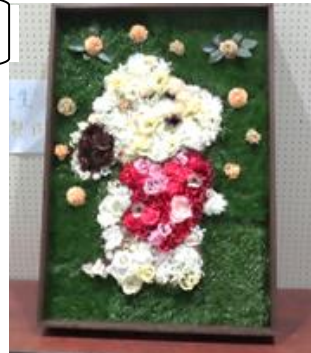
← びじゅつぶさく 美術部作