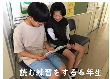
読む練習をする6年生

ほんこう ねんせい いいんかいかつどう 本校では、5・6年生が委員会活動をしています。 じどうかい きゅうしょくいんかい ほうそう こうほういいんかい としよいいんかい 児童会、給食委員会、放送・広報委員会、図書委員会、 ほけんいいんかい さいばい び か いいんかい たいいくいいんかい 保健委員会、栽培・美化委員会、体育委員会の7つの いいんかい なか じぶん えら しょぞく たと 委員会の中から自分で選んで所属しています。例えば、 ほうそう こうほういいんかい まいにち しんぶん よ じぶん す 放送・広報委員会は、毎日、新聞を読んで、自分の好きな きじ えら 読む練習をして、お昼の放送で発表しま す。どんな記事を選ぶのか、毎日楽しみにしているのは、 わたし だけではないようです。この日は、「1年生が聞いているからゆっくり読もう」と声をかけ合っていました。