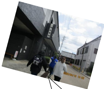
上野図書館は初めてやわ。

毎月、上野図書館に本を借りに行っています。団体で借りることができるので、毎回40冊ほど借りています。選ぶ本は通級生が中心ですが、スタッフが読みたいもの（通級生に読んでほしいもの）も入れてたくさんあります。その時に、通級生と話題になっていることや作りたいものに関する本が多いです。もちろん、個人のカードを持っている人は、それを使って借りるのもOK。これからいろんなジャンルの本を借りていきたいと思います。