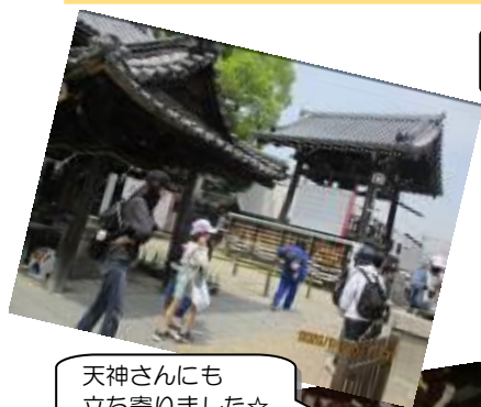
天神さんにも立ち寄りました☆

伊賀のまちなかや上野城を散策しました。天候もこの日は暑すぎず、寒すぎず、絶好の遠足日和でした。みんなで至るところにある忍者のだまし絵を探し、「こんなポーズはどうか？」「一緒に撮ろうよ！」などワイワイしながら写真を撮をたくさん撮りました。上野城では、城内から伊賀のまちなみを一望でき、「うわあ、きれい！」と思わず声を漏らす子もいました。お城の急な階段を上り下りするのに、子どもたち同士で声を掛け合っている姿も。帰ってきてスタッフが歩数計を見るとなんと1万歩超えにびっくり。子どもたちからは「楽しかった。」「あそこにあったお店また行ってみたい。」という声も聞こえてきて、伊賀のよさの再発見にもつながり、充実した1日になったようでした。