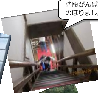
階段がんばってのぼりました！