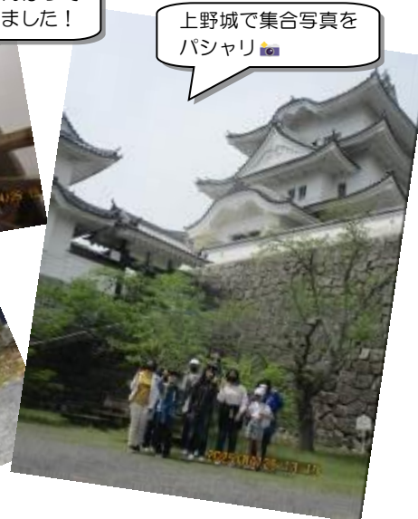
上野城で集合写真を撮バシャリ📷