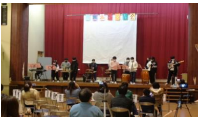
【昨年度の舞台発表の様子】

毎年、子どもたちが生き生きと活動する様子を見ていただける大事な機会となっております。この2年間は、新型コロナウイルス感染防止のため、通級生の担任の先生や管理職の方に限定させていただきましたが、今年度は少しでも多くの教職員の皆さんにご参加いただけるよう検討しているところです。子どもたちの頑張りや成長をじっくりとご覧ください。