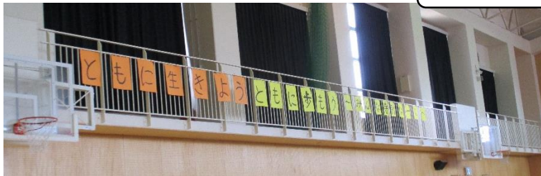
体育館のメッセージ展示