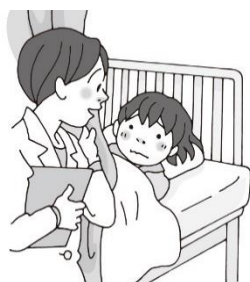
体調が悪いときに休む