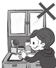
保健室のものは 勝手に触らない