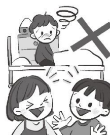
保健室では静かにする