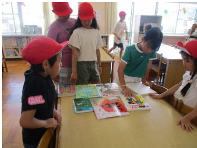
☆数字の書いてある本をさがそう