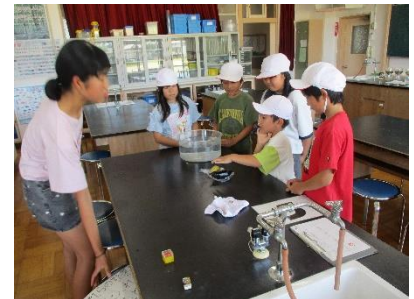
☆水に浮かぶのはどの野菜?