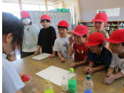
☆オレンジ色を作るには??