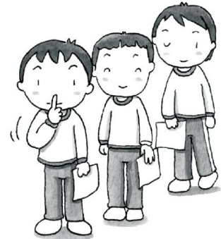
しず ま 静かに待つ