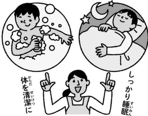
からだ せいけつ 体を清潔に