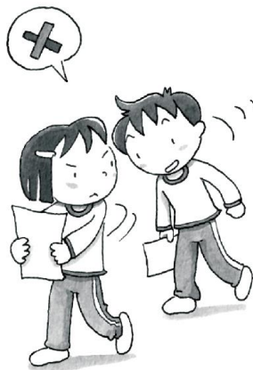
ひと けっか 人の結果をのぞかない