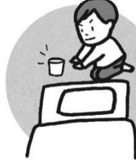
容器を枕元に置いて寝る