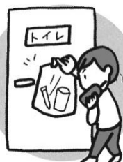
容器をトイレのドアに貼っておく