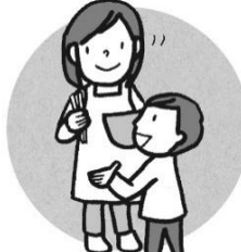
家族の人に話しておく