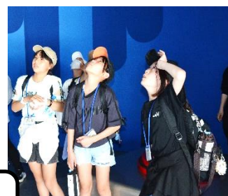
おおさか かんさいばんぱく 大阪・関西万博