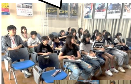
こうべざいかんこうほうてんじしつ 神戸税関広報展示室