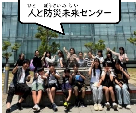
ひと ぼうさいみらい 人と防災未来センター