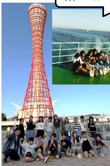
こうべ 神戸ベイクルーズ