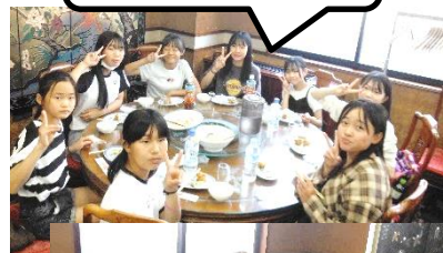
ちゅうかりょうり ちゅうしよく 中華料理の昼食