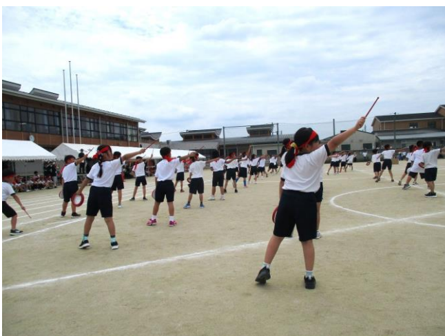
3・4年生 心をひとつに ～友生ぬ宝 2025～