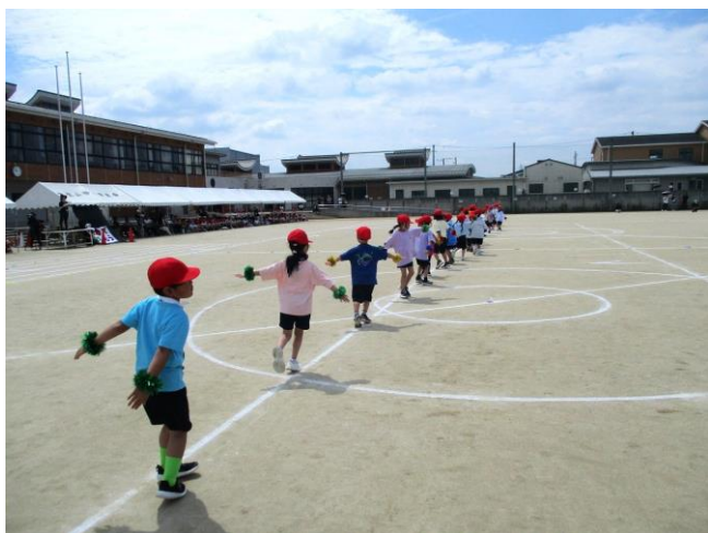
1年生 ～めっちゃかわ☆1年生～