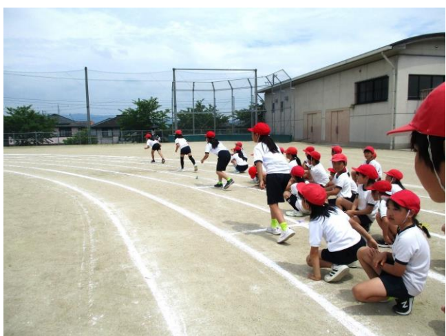
3年生 80m走 ～ゴールにおかって走りぬけ～