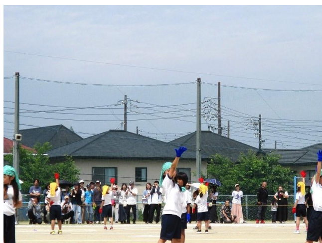
2年生 ホットな51人 ～さわげ！！かいじゅうのうた～