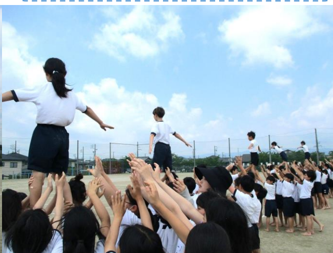
5・6年生 絆 ～Let's smile star～