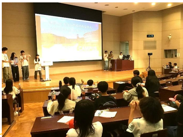
大学生…、カッコいい。

しょくじ あと だいがくせい かた だいがく こうぎ かつどう せつめい う こうない あんない いただ 食事の後、大学生の方に、大学の講義やクラブ活動などについて説明を受けたり、構内を案内して頂 いたり、充実した時間を過ごしました。