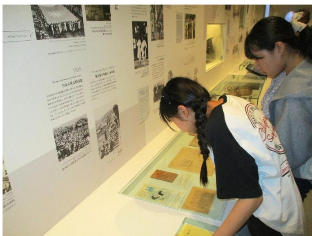
思わず見入ってしまいます。

1日目最初の見学地、立命館大学国際平和ミュージアムでは、人権や平和について様々な提起されている中から、自分で考えた課題について学びました。熱心に学習する姿を見たガイドの方から、「普段から学んでいるのですね」と声をかけて頂くほど意欲的に取り組みました。