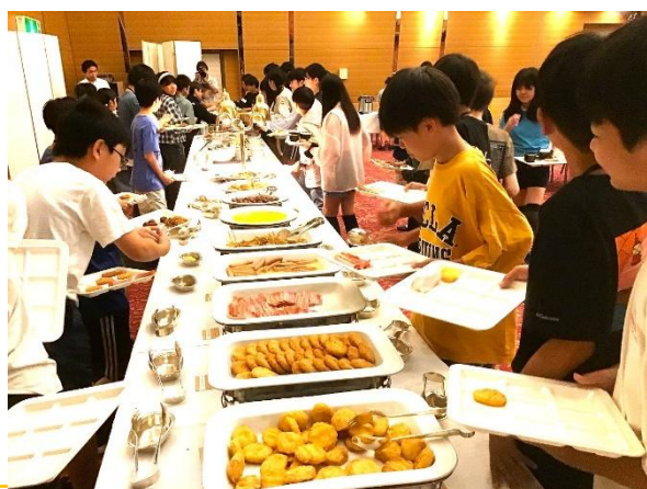
朝食は楽しいbuffet形式。

ふつかめ さいしよ けんがくち きよみずでら かんこうきゃく たいへん にぎ なか けんがくご わ か 2日目の最初の見学地は清水寺です。観光客で大変な賑わいの中、見学後はグループに分かれて買 もの たの あと さんじゅうさんげんどう けんがく たの うずまさえい がむら はんべつこうどう い物を楽しみました。その後は三十三間堂を見学し、いよいよ楽しみにしていた太秦映画村。班別行動の メンバーで相談しながら、最後の見学地を満喫しました。