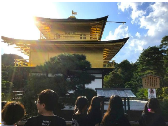
金閣寺。「きれい・・・。」とため息が聞こえます。