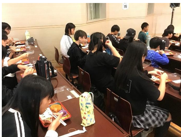
大学側のご厚意で昼食場所をお借りしました。

がくしゅう あと だいがく こうい へ や ようい いただ 学習の後は、大学のご厚意で部屋を用意して頂き、みんなで修学旅行最初の食事を楽しみました。