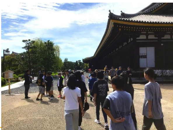
三十三間堂。天候に恵まれた二日間でした。