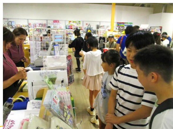
買い物も楽しみ。家族と、友達と、自分のも。

いちにちめ あさ こ な ばしよ かんきよう けが じ こ げん き かえ はなし 「1日目の朝、子どもたちに「慣れない場所、環境で怪我や事故のないよう、元気に帰ってくること」と話をしました。子どもたちは、それぞれが自分で考えて行動し、しっかり約束を守ることができました。