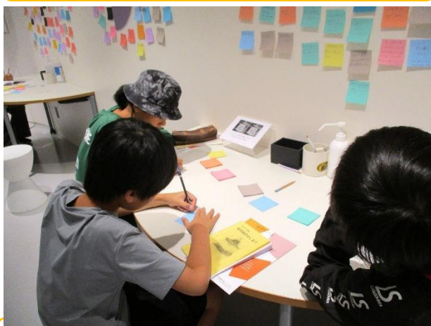
自分たちのメッセージを書き込みます。