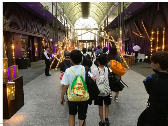
ホテルに到着。ここでは歓声が起こります。