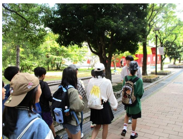
愉快的説明に、思わず顔もほころびます。

りつめいかんだいがく あと りょうあんじ きんかくじ けんかく きょうと ゆた れきし たの 立命館大学の後は、龍安寺、金閣寺を見学しました。京都の豊かな歴史を楽しむことができました。