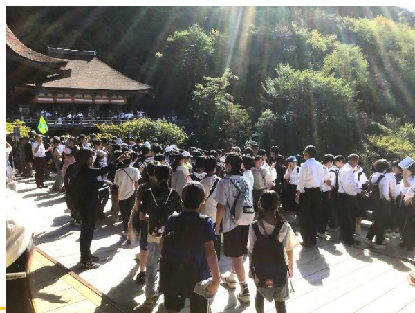
清水寺。それにしてもすごい賑わい。