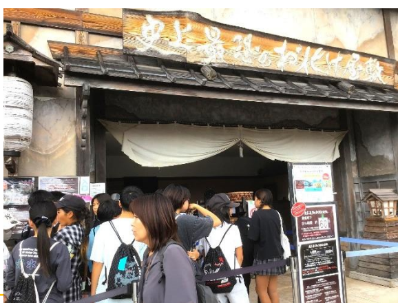
お化け屋敷。…入るか、辞めるか…。