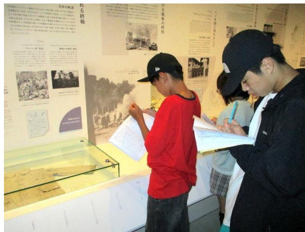
時間を忘れて学びます。