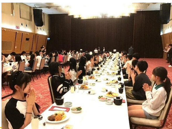
みんなで食べる夕食も、旅行の醍醐味。