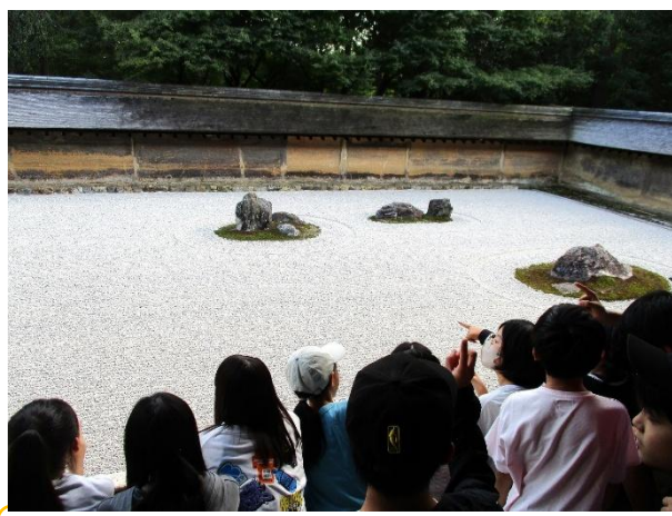
龍安寺。悟るというより、喧々ガクガク…。