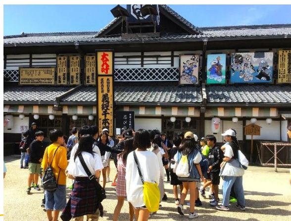
最後の見学地となる映画村。