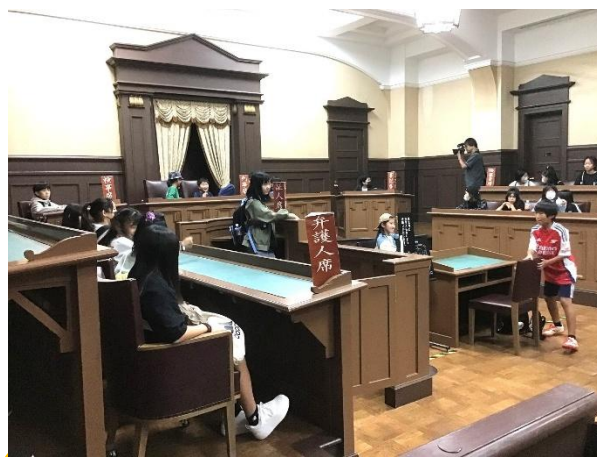
日本に2つだけ残っている珍しい場所。

しょくじ あと だいがくせい かた だいがく こうぎ かつどう せつめい う こうない あんない いただ 食事の後、大学生の方に、大学の講義やクラブ活動などについて説明を受けたり、構内を案内して頂 いたり、充実した時間を過ごしました。