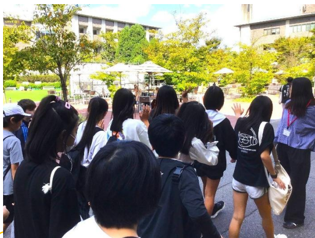
国際色が豊かなキャンパスで、「ハロー！」

りつめいかんだいがく あと りょうあんじ きんかくじ けんかく きょうと ゆた れきし たの 立命館大学の後は、龍安寺、金閣寺を見学しました。京都の豊かな歴史を楽しむことができました。