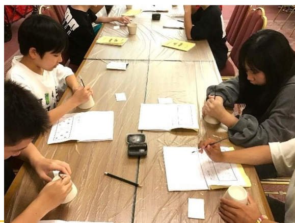
夕食後に、楽しみにしていた絵付け体験。

ふつかめ さいしよ けんがくち きよみずでら かんこうきゃく たいへん にぎ なか けんがくご わ か 2日目の最初の見学地は清水寺です。観光客で大変な賑わいの中、見学後はグループに分かれて買 もの たの あと さんじゅうさんげんどう けんがく たの うずまさえい がむら はんべつこうどう い物を楽しみました。その後は三十三間堂を見学し、いよいよ楽しみにしていた太秦映画村。班別行動の メンバーで相談しながら、最後の見学地を満喫しました。